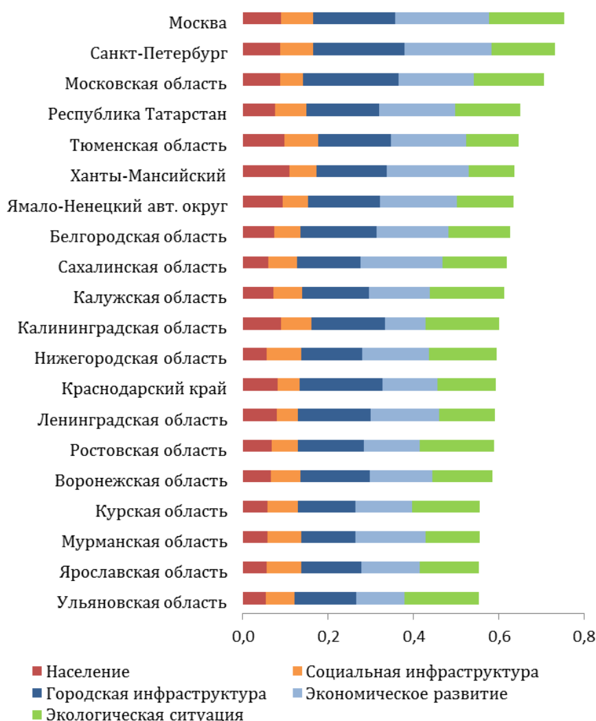
Рисунок 1. ТОП-20 лидеров Рэнкинга УР Регионов России

По результатам рэнкинга УР регионов в пятерку лидеров вошли Москва, Санкт-Петербург, Московская область, Татарстан, Тюменская область. Это регионы, население которых превышает 4 млн человек и которые входят в число крупнейших субъектов РФ по объему ВРП. В ТОП-10 также вошли Ямало-Ненецкий и Ханты-Мансийский автономные округа, Белгородская, Сахалинская и Калужская области.